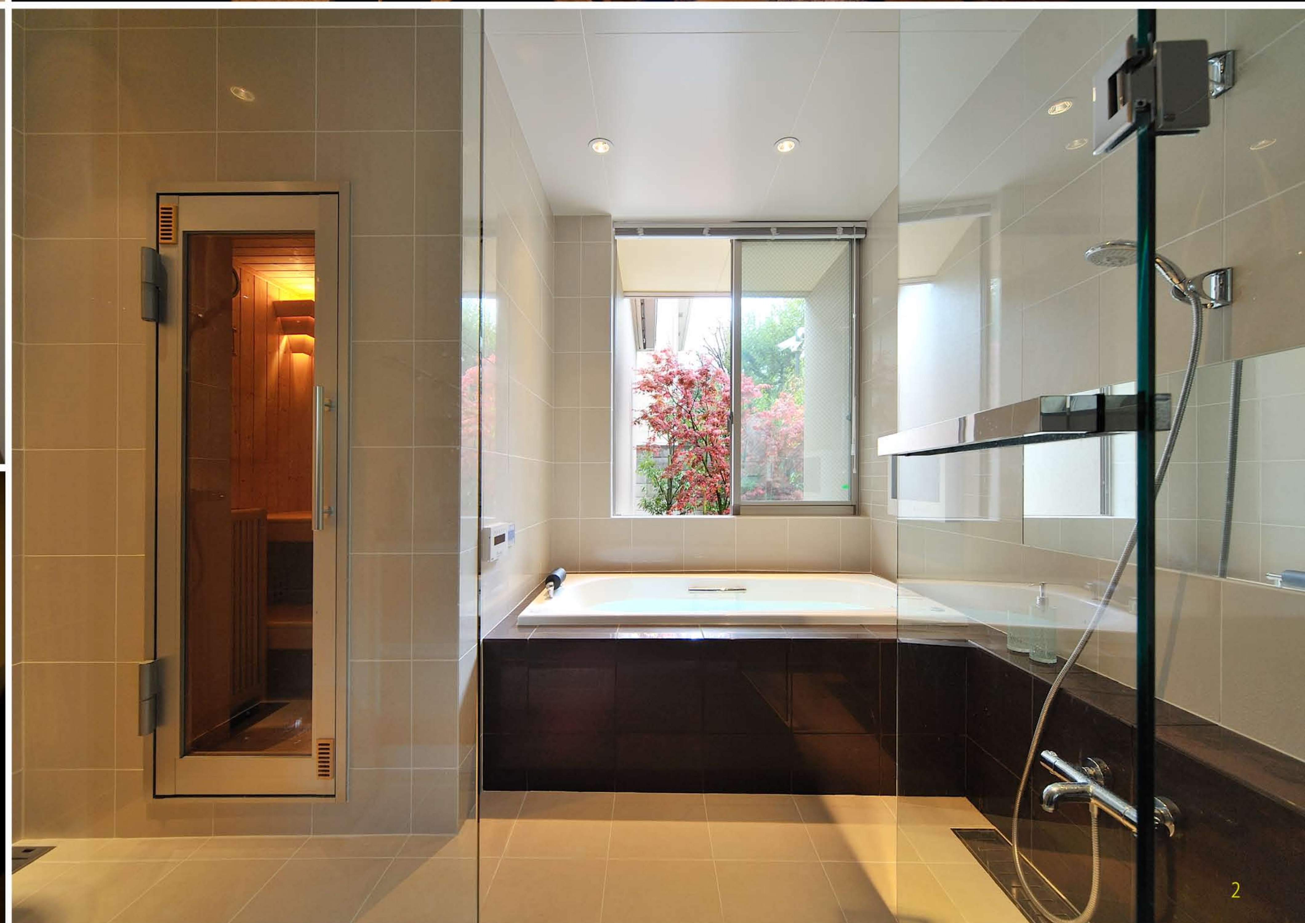
1 屋上の夕景。リゾート気分を味わわせてくれる星空の下のジャグジー。2 開放感のあるバスルーム。左手にはサウナルームを配しました。3 本格的なアスレチックマシンを配したジムスペース。ガラスのショーケースには愛車を眺めることが出来る。4 静寂に満ちた空間の和室。四季の趣が感じられます。天井の照明には松のデザインを施しました。5 ゆったりと趣味の世界に籠ることのできるオーディオルーム。6 1階パーコーナー。ホテルライクな仕様で憩いの時間を演出します。7 視線の先の庭の広がりを感じさせる1階地窓