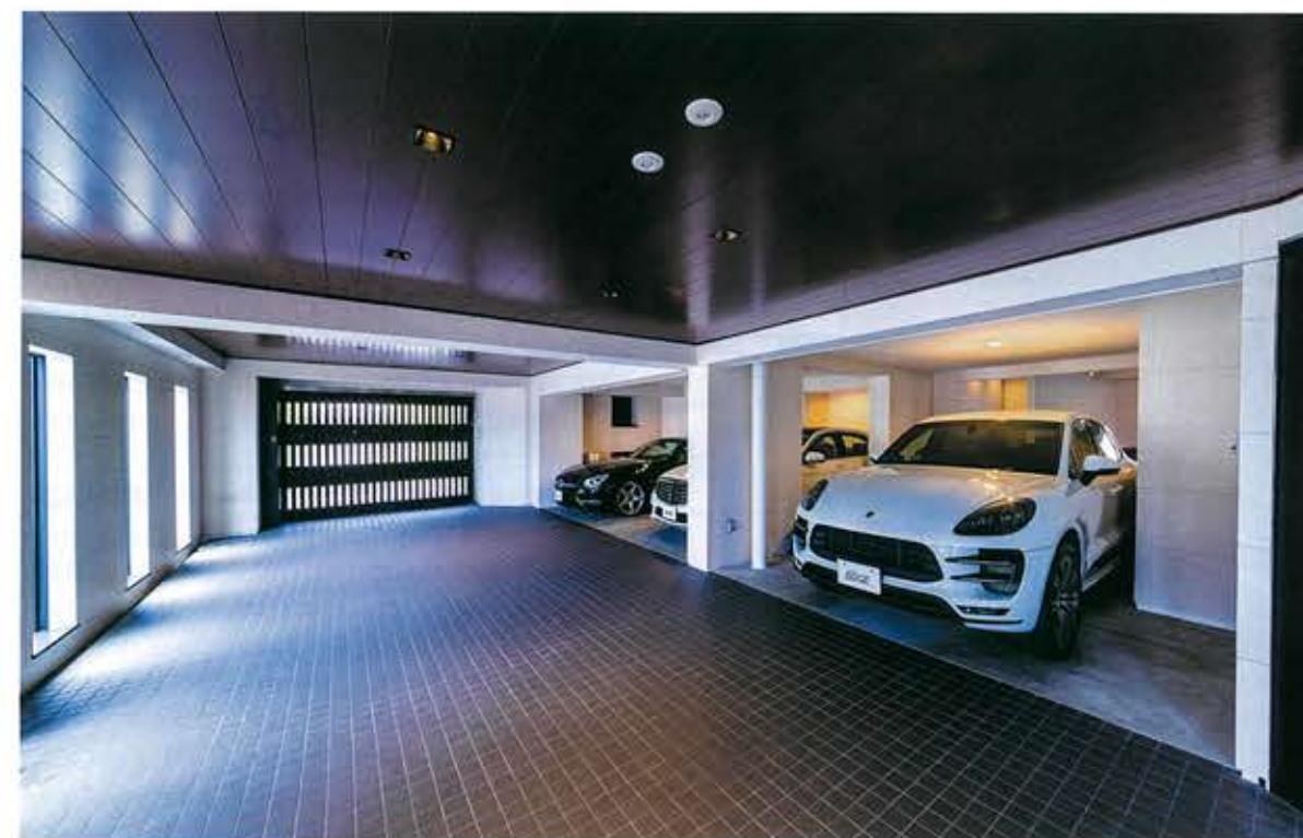
④横開きの格子状ドアのせいか、爽やかな雰囲気が漂うガレージ内部。奥様の愛車マカンの後方に、F355スパイダーが収まっている