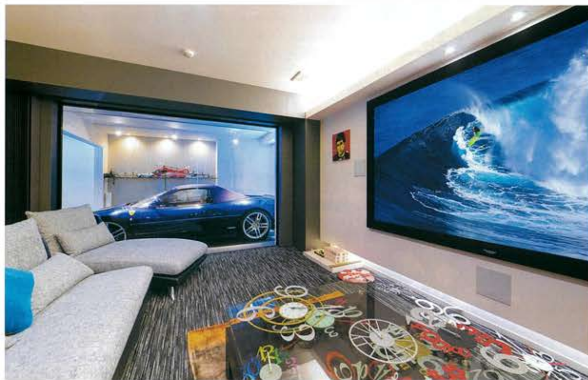
①愛車を身近に感じながら寛げるシアタールーム。部屋の照明を落とすと、ガレージのF355スパイダーが美しく浮かび上がる