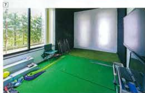
⑤ 運河を見下ろす3階のリビング&ダイニングルーム。10名ほどのパーティを頻繁に開催するという ⑥ 明るい自然光に包まれる1階のエントランスホールに入ると、愛犬のイラストが迎えてくれる ⑦ 仕事柄、スイングのチェックや飛距離の確認など、Tさんは自宅でのトレーニングに余念がない

と、絶賛。和モダンをもっとも象徴する空間が、3階の和室だ。そこには隠れ扉のような引き戸があり、開けると黒石が敷き詰められた和室へのアプローチが出現する。ここには、洋から和へ雰囲気を変える役割が与えられているという。