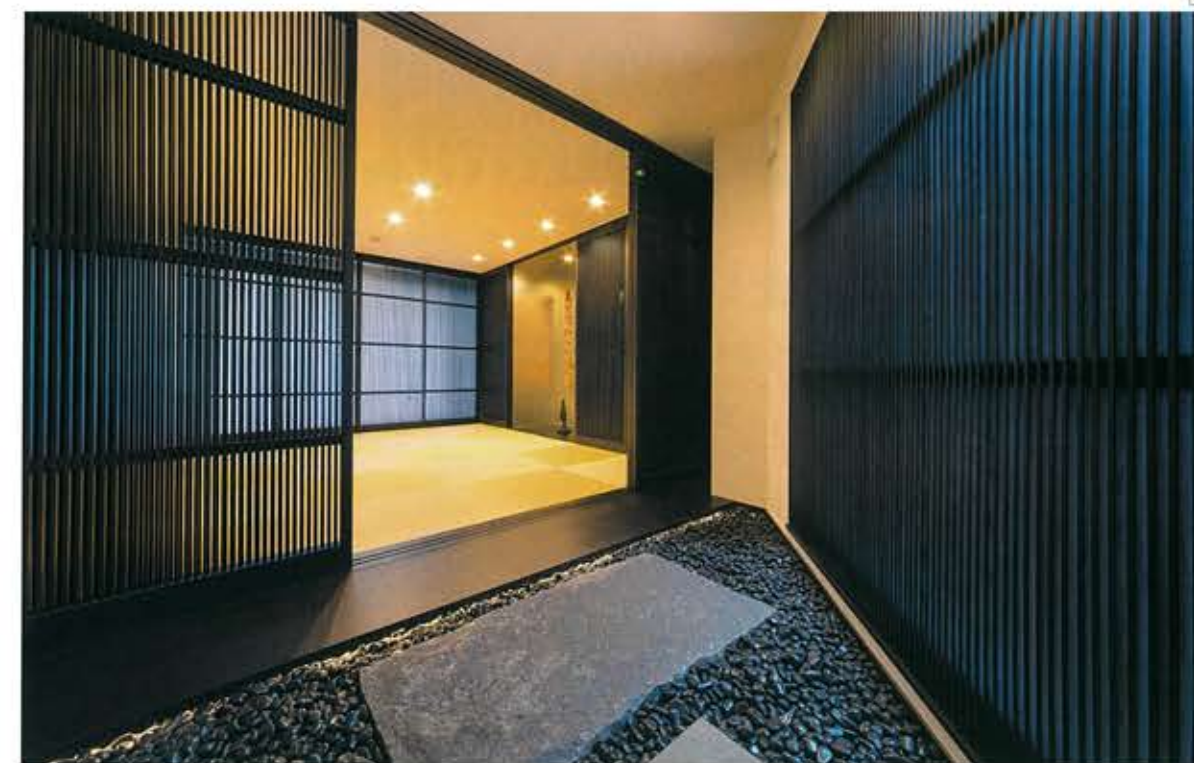
⑧ 丹波の黒石が敷き詰められたアプローチを通ると、T邸のデザインコンセプトである「和モダン」を象徴する和室へと至る ⑨ 3階のテラス部分にはゲスト用のジャグジーを備えており、滞在中のくつろぎを提供する

旗竿敷地という制約の多い土地形態において、デザインと機能が絶妙なバランスで設計されたT邸。施主の要望を満たすだけでなく、期待以上の価値を提供する。そんなT邸は、和モダンのコンセプトどおり、和と洋が巧みに融合し住む人の安らぎとカーガレージライフとが共存できる作品であった。