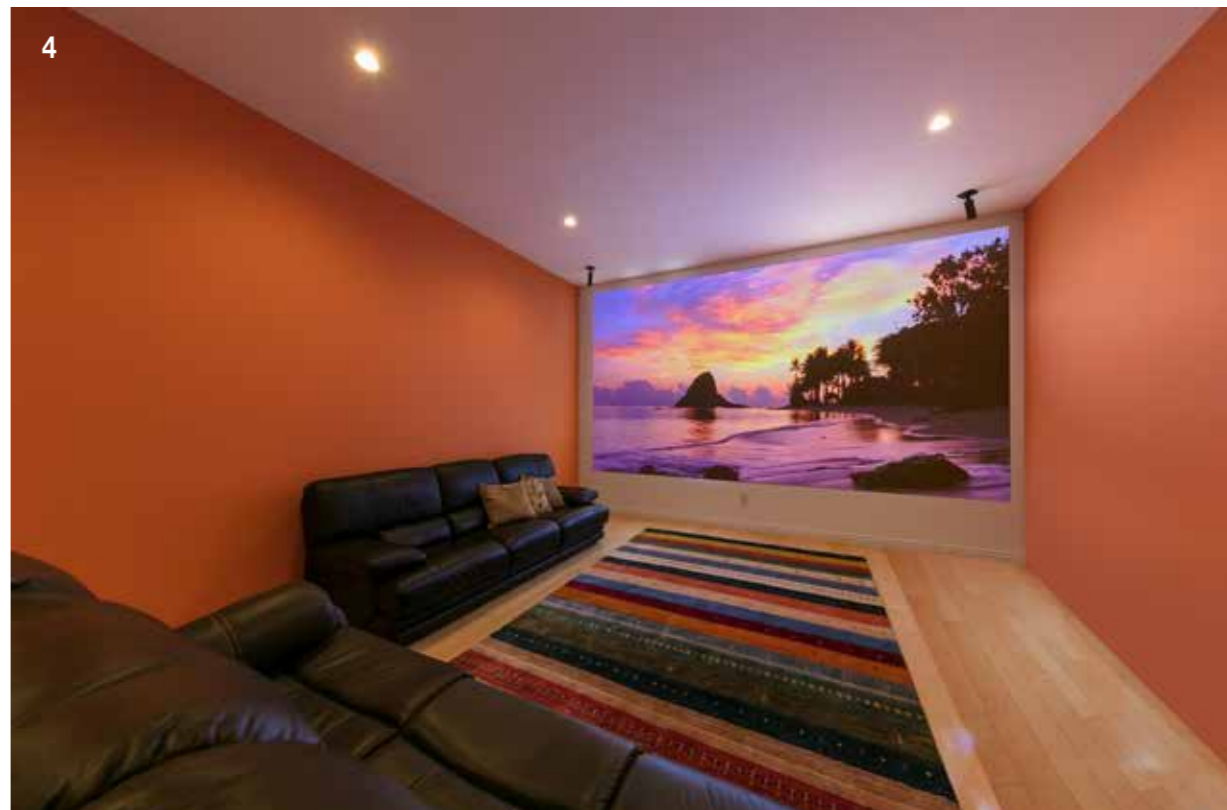
1. 立ち上がりに使用したマジョリカタイルと、四季を表わしたステンドグラスがゲストを迎える。2. 大理石を贅沢に使用したエントランスホール。3. ハイサイドライトから光を取り込み、イエローの壁が部屋に快活な印象を与えるご主人の書斎。4. 地階にあるホビールームは壁一面に映し出される美しい映像と上質なサウンドを楽しむ。5. 高層ビル群のスカイラインに屋上の緑が浮遊するルーフガーデンは、愛犬のドックランとしても使用可能。6. 主寝室は出入口の他に、ウォークインクローゼットやパウダールームなどの扉をすべて同じデザインで合わせた。7. レストランは寒色を使った清潔感のあるさわやかな印象。