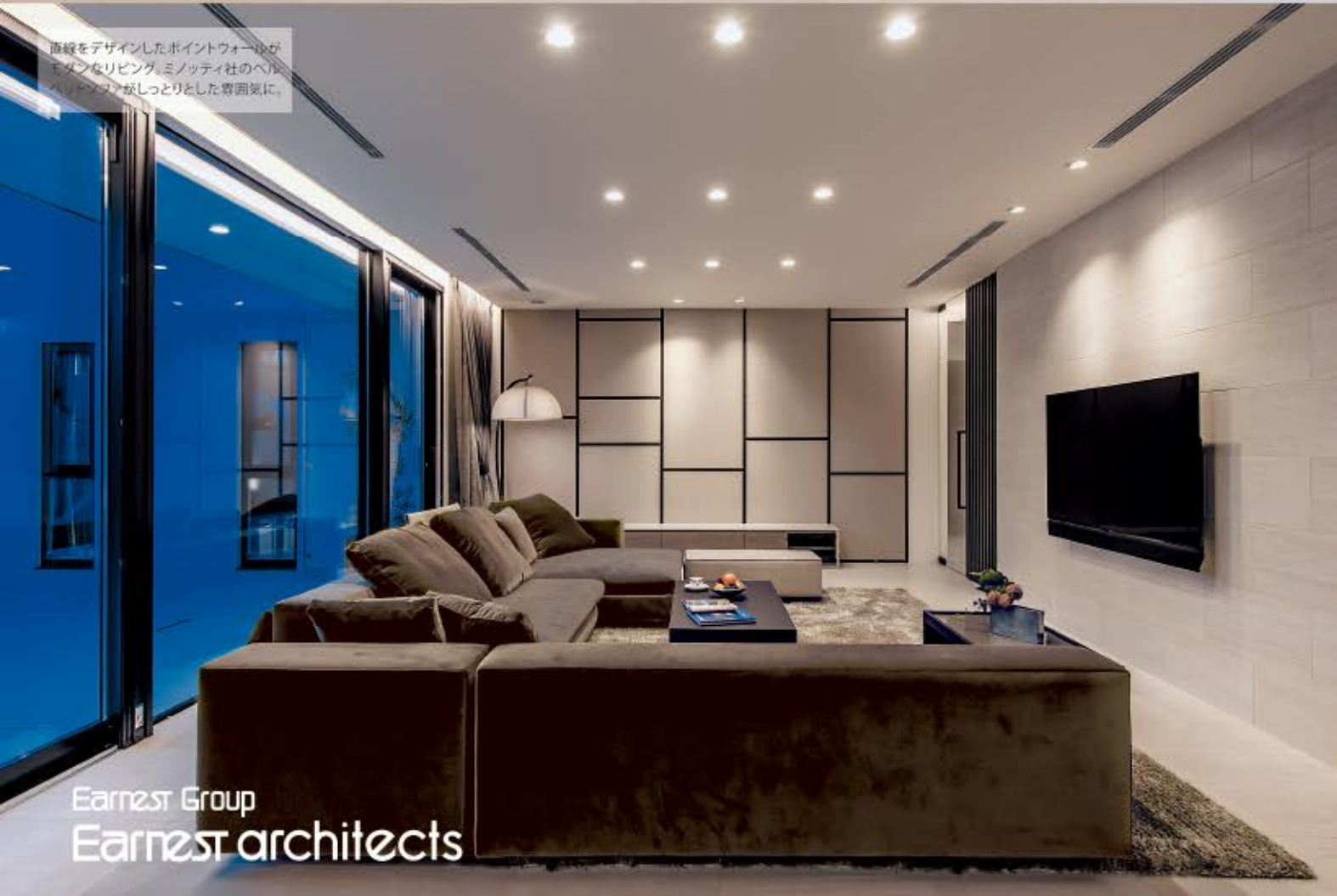
直線をデザインしたポイントウォールが、モダンなリビング。ミノッティ社のベル・スリムソファがしっとりとした雰囲気。