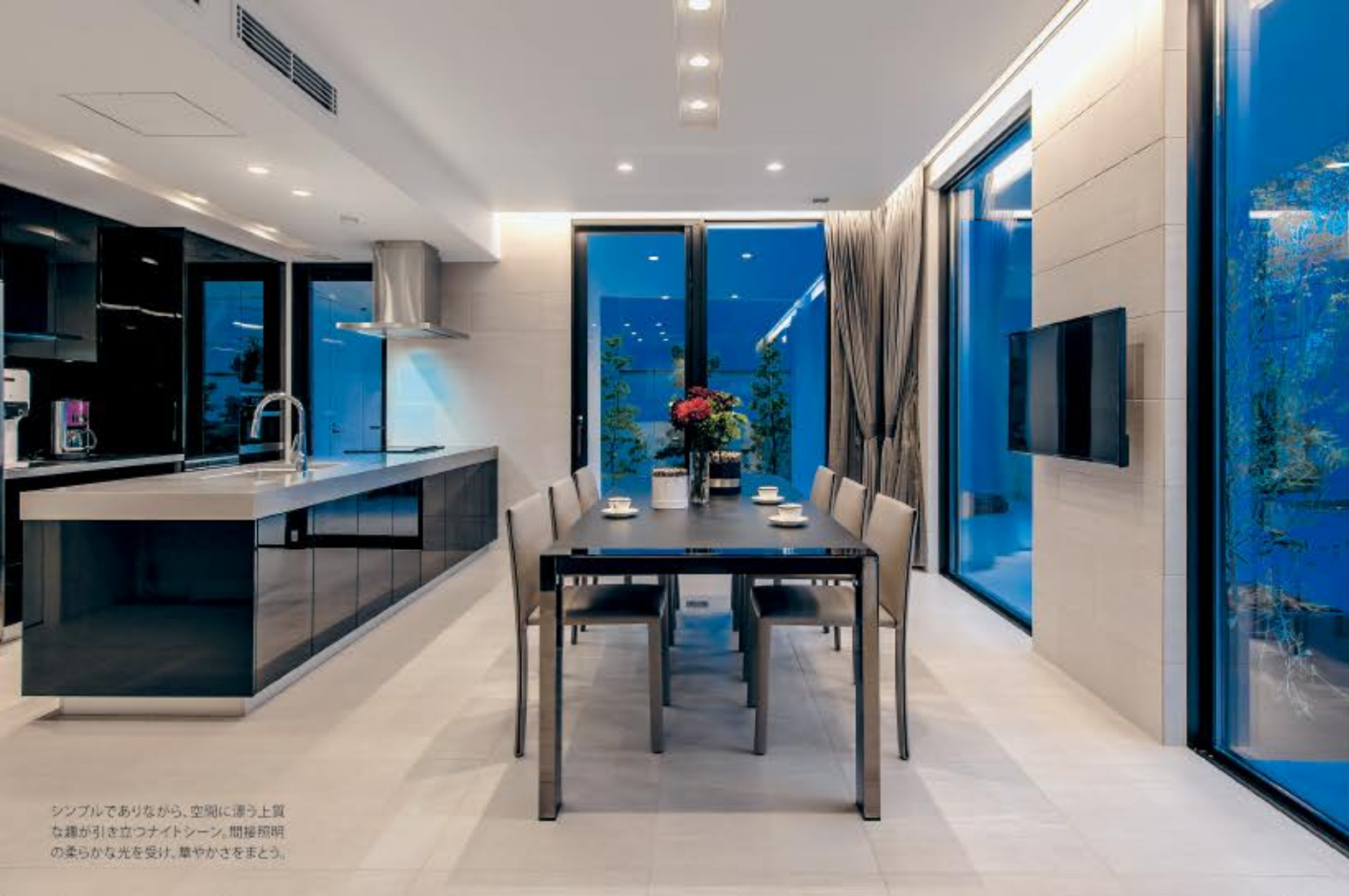
シンプルでありながら、空間に漂う上質な輝が引き立つナイトシーン。間接照明の柔らかな光を受け、華やかさをまとう。