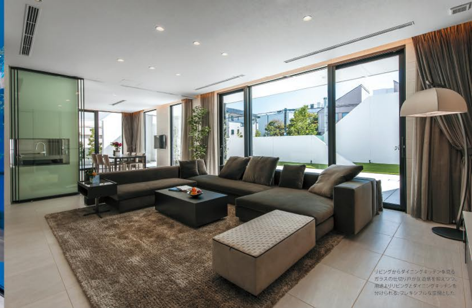
リビングからダイニングキッチンを見るガラスの仕切り戸が圧迫感を抑えつつ、用途よりリビングとダイニングキッチンを分けられる、フレキシブルな空間とした。