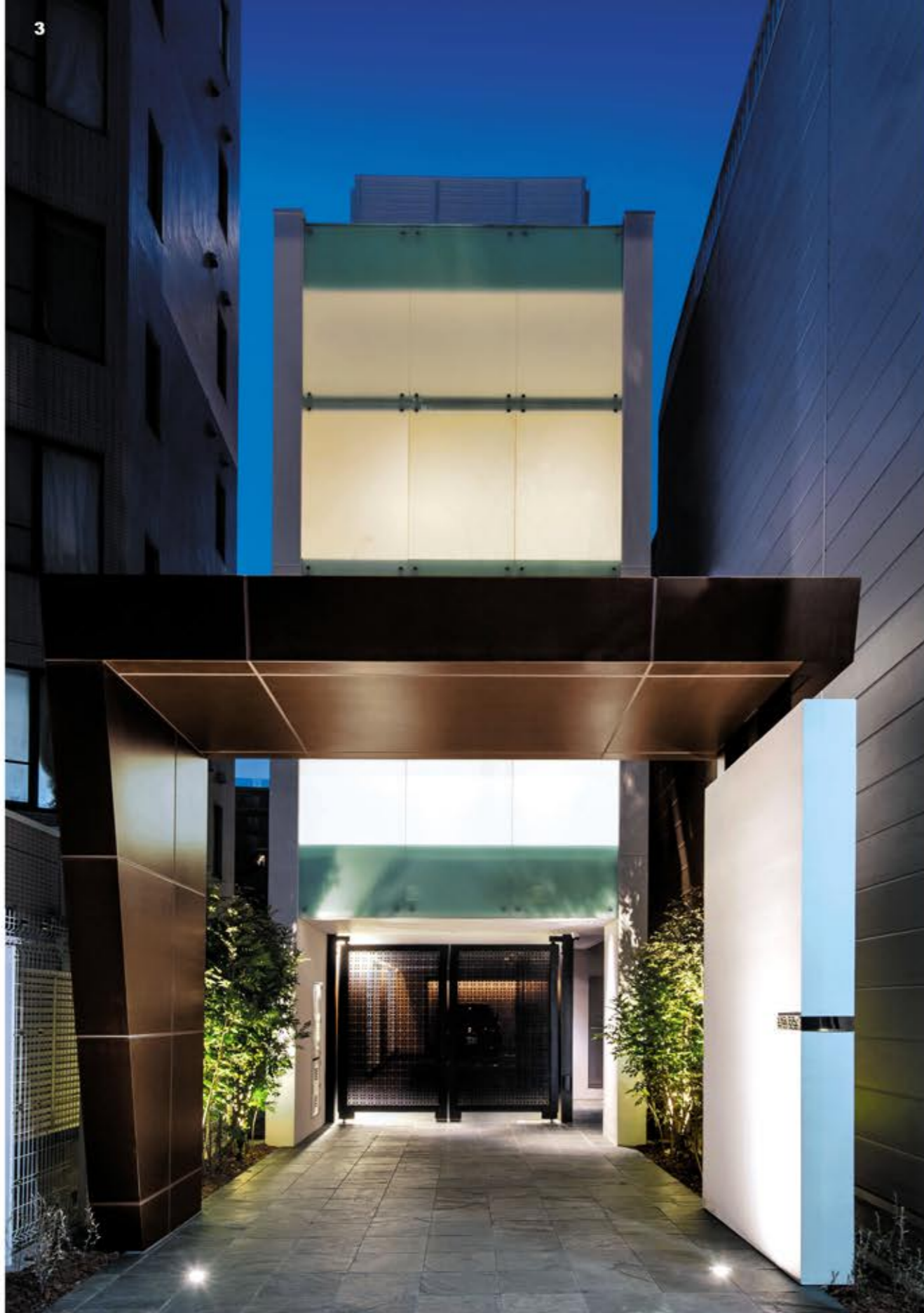
1. 都会の喧騒が、暮れゆく夕日と共に窓をつたうウォータースクリーンの水により美しくにじむ。2. 床と天井に施されたフローリングにより、一層奥行きを感じるLDK。3. 銅板のようなスチール製のパネルがスタイリッシュなゲートを演出。前面に施した乳白ガラスから室内のやさしい光がもれる夜の外観。